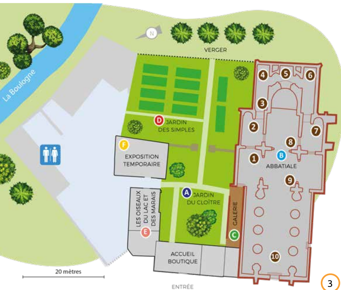
Plan du Site de l'abbatiale - Déas